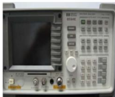
HP 8594E 频谱分析仪