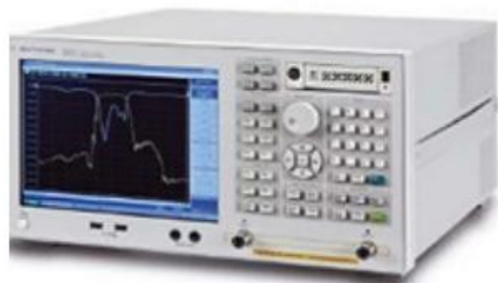
安捷伦 E5071C 网络分析仪